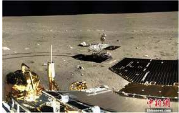
Yutu en arrière-plan de son lander dans le golfe des Iris

Après quinze jours passés dans la nuit lunaire, le « lapin de jade » chinois ne s'est pas « réveillé » lorsque, le matin du 9 février, le Soleil s'était levé sur le Golf des Iris. Mais, après trois jours d'attente, et probablement une fois réchauffés les composants électroniques du robot, les ingénieurs chinois ont réussi à reprendre le contact avec Yutu ! Il fallait maintenant vérifier que l'ensemble des éléments du rover n'avait pas souffert et essayer de reprendre le contrôle des différents dispositifs.